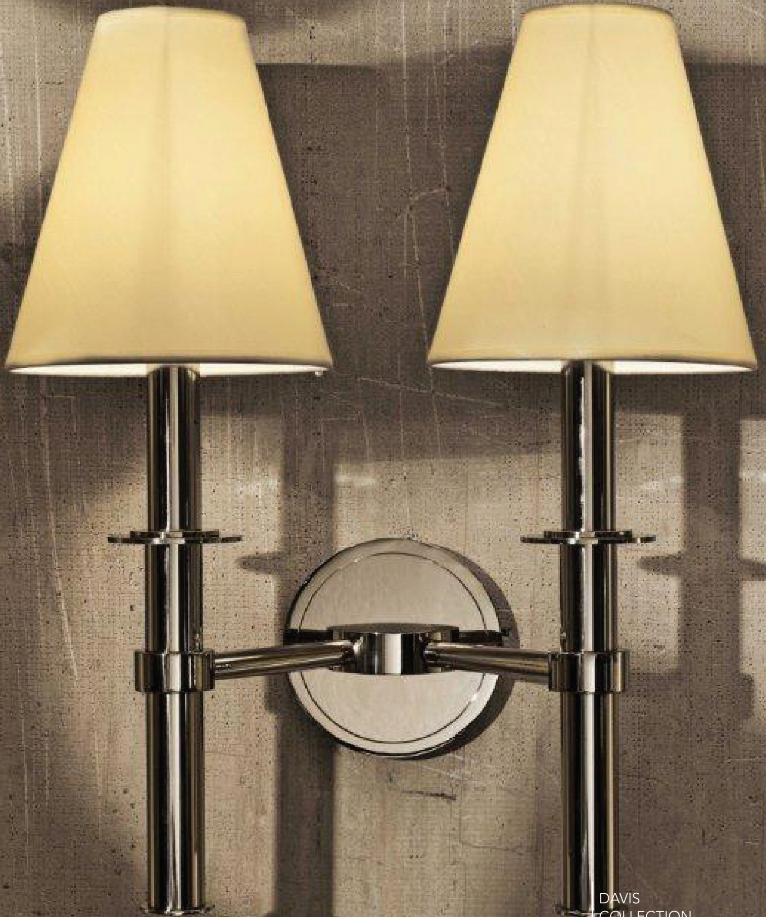
DAVIS COLLECTION DC 31.2