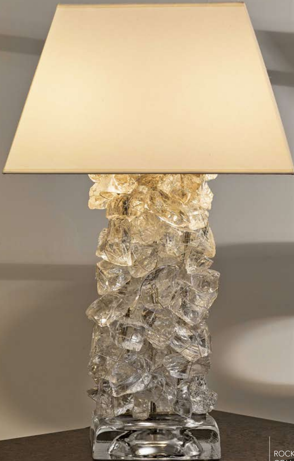
ROCK CRYSTAL COLLECTION RC 54