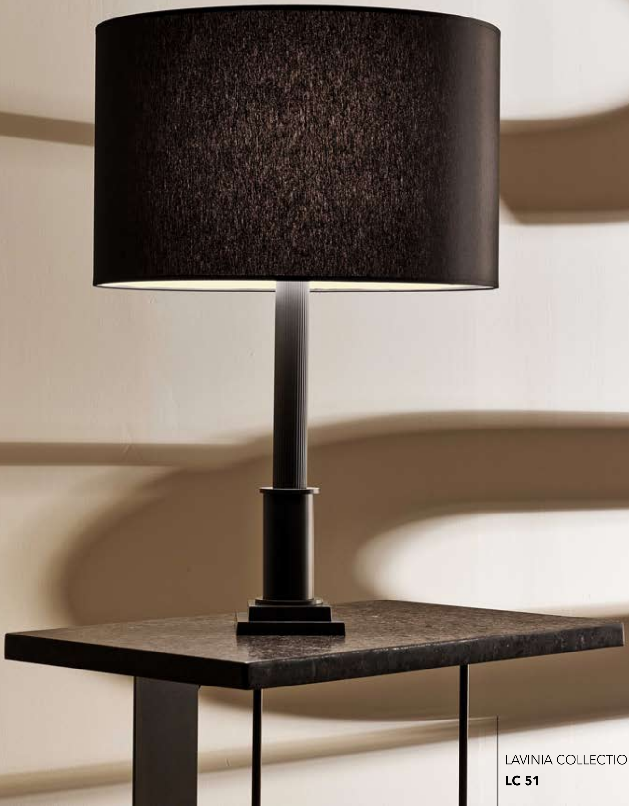
LAVINIA COLLECTION LC 51